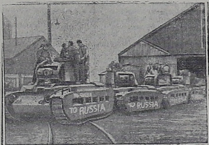
Неделя „Танки для СССР“ в Англии.

Мы победим лютого врага! Этому порукой— железная решимость всего советского народа отдать все свои силы на борьбу против фа- шистского зверья. Этому порукой—готовность народа идти на любые жертвы во имя отпора врагу, во имя спасения нашей Родины. Этому порукой—любовь к Родине и ненависть к вра- гу, пылающие в сердцах советских людей. Все силы—на отпор врагу! Победа будет за нами!